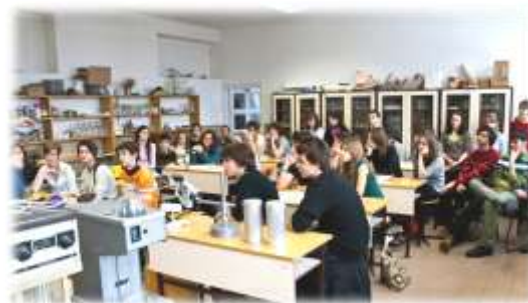
Az ifjú „kutatók” előadásokat hallgatnak