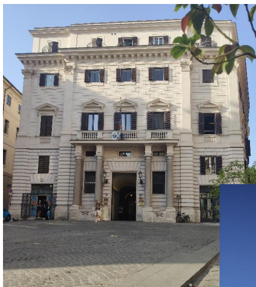
A nyelviskola épülete