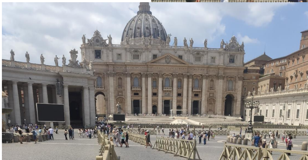
Szent Péter bazilika