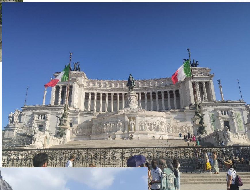
II. Viktor Emmánuel emlékműve