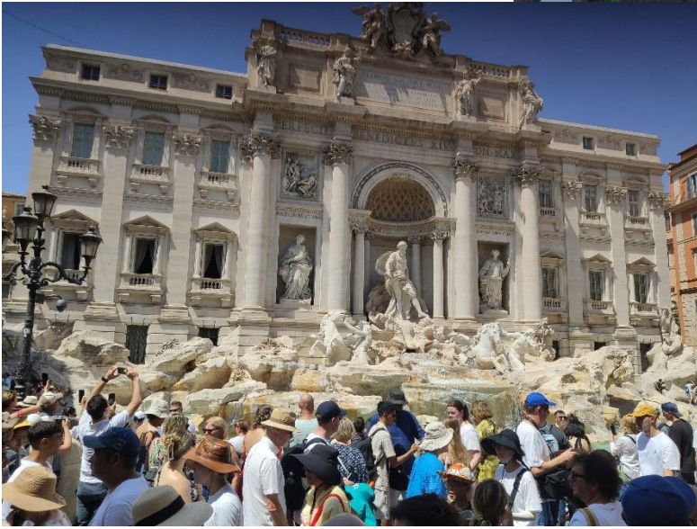
Fontana di Trevi