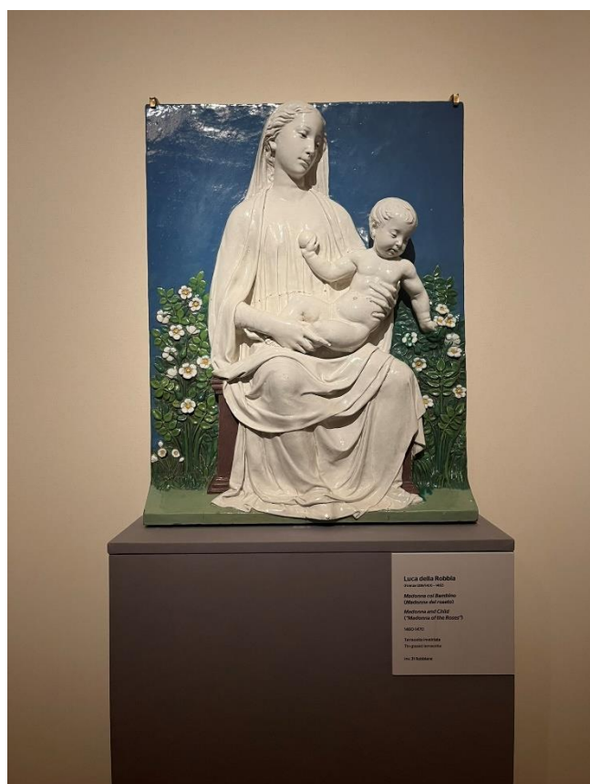
Lucca della Robbia: Madonna gyermekkel (Rózsás Madonna)