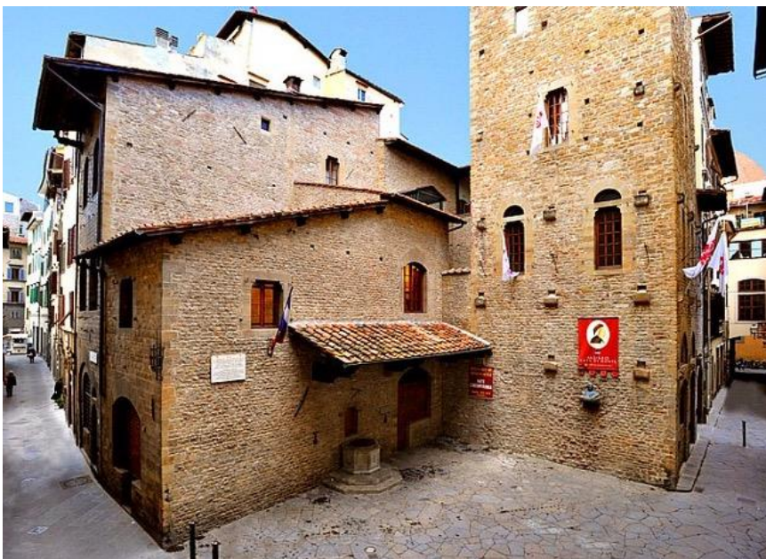
Museo Casa di Dante, via Santa Margherita