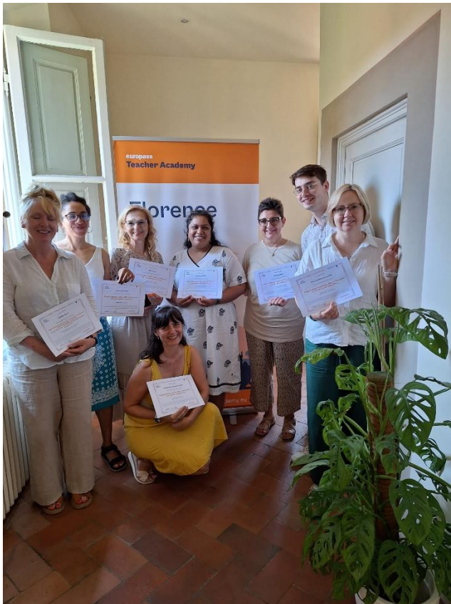
Egy csodás hét eredménye