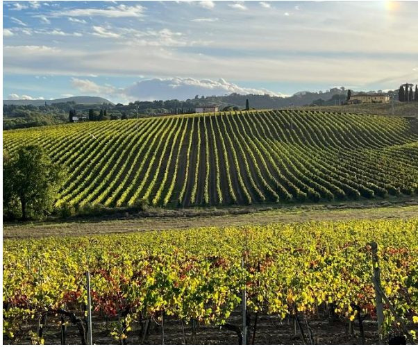
Érik a szőlő