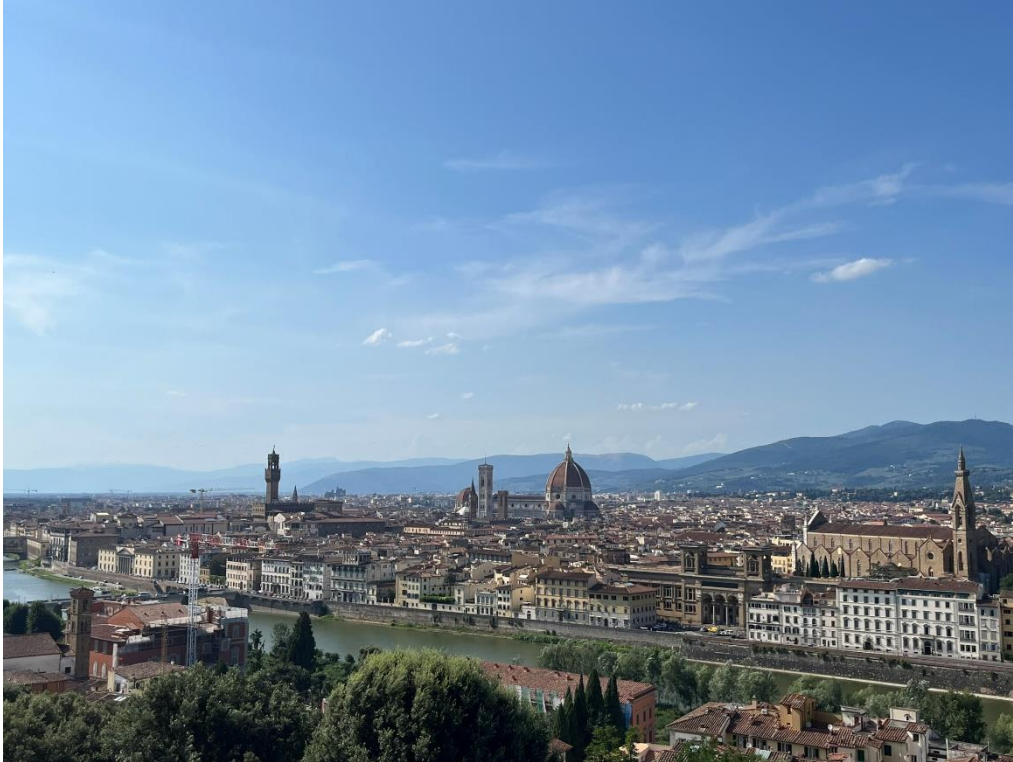
Firenze a Piazzale Michelangeloról

Az új ismeretek elsajátítása mellett volt lehetőség Firenzetovábbi látnivalóival is megismerkedni. A Piazzale Michelangeloról csodálni a várost, elmerülni Dante korában, és végigjárni Brown Dan Infernojának firenzei állomásait, sétálni a naplementében. S persze jókat enni és inni. A hetet egy kiráduállással fejezük be a Chianti vidékre.