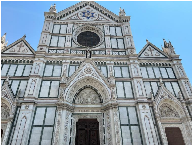
Santa Croce Bazilika

A képzés során megismerkedtünk a projektalapú tanulás alapfogalmaival és megtettük az első projektünk kezdőlépéseit is. a képzésen egyedüli matematikatanárként vettem részt, minden csoporttársam angol nyelvtanár volt. Ez időnként megnehezítette a kommunikációm, de társaim nagyon segítőkészek voltak, ha egy-egy kifejezés nem jutott az eszembe. A tanfolyamnak része volt két múzeumlátogatás is, kedden a Santa Croce bazilikát jártuk be egy előre elkészített feladatlap segítségével. A kitöltéshez használhattunk internetes segítséget is, bár az viszonylag nehezen működött a vastag középkori falak miatt. Így a kerengőben ültünk le az írásbeli munka elvégzéséhez.