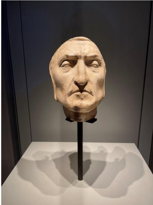
Dante halotti maszkja a Palazzo Vecchioban